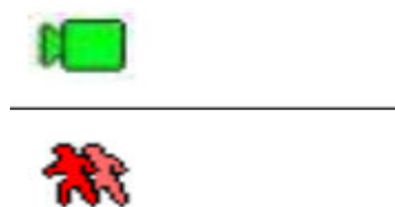
Imagen 5 - Detección de movimiento y grabación activadas.

Luego de realizar los 3 pasos, deberían verse 2 iconos en el vértice inferior izquierdo de cada canal. El ícono verde indica Grabación y el rojo Detección de movimiento. Según la versión de firmware es probable que el Rojo sólo se muestre cuando se detecta movimiento y el verde solamente cuando se ejecuta la grabación producto del movimiento. Ver imagen 5.