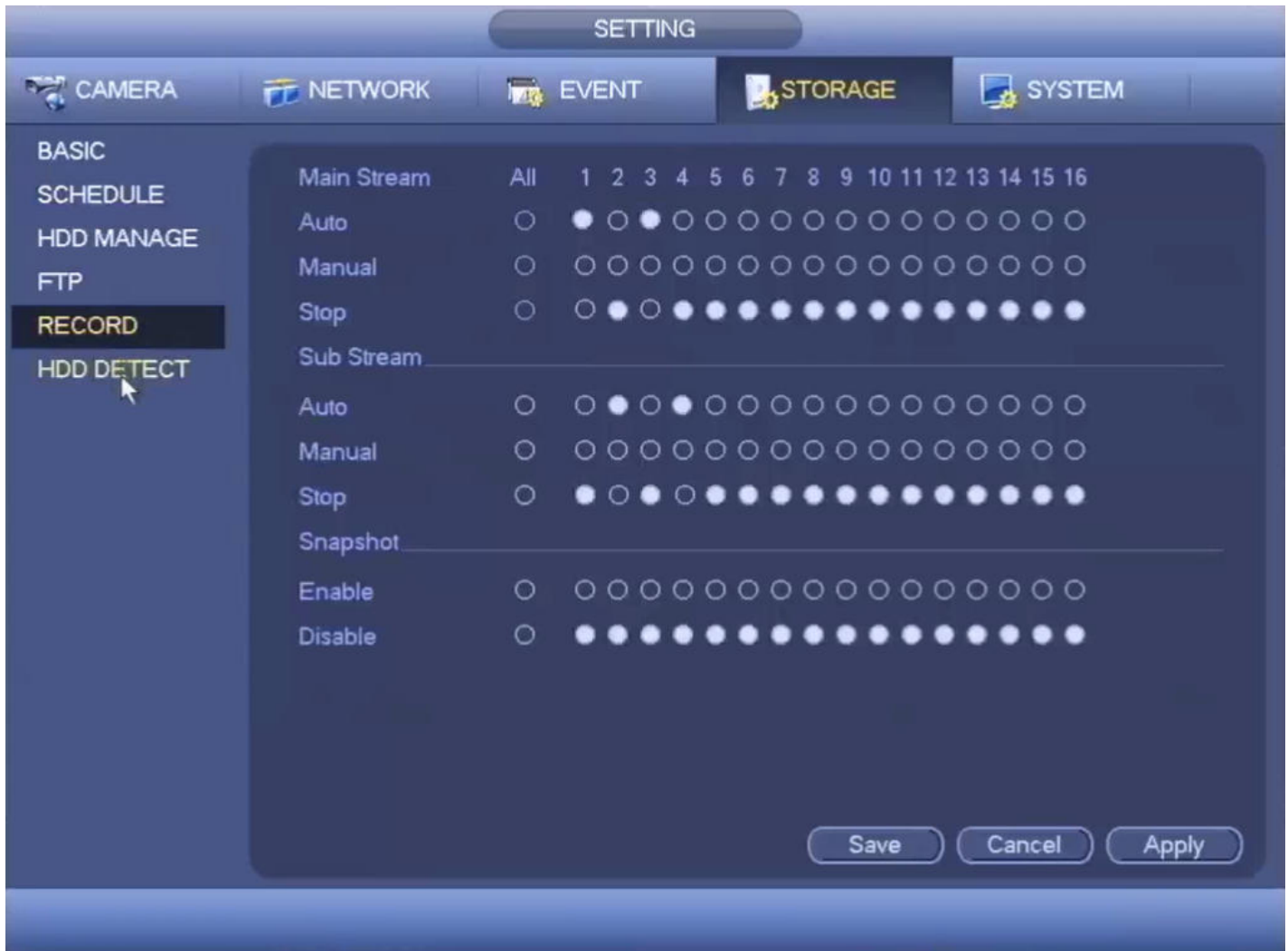
Imagen 4 - Grabación automática para los canales 1 y 3 en Main Stream y 2 y 4 en Sub Stream

Luego de realizar los 3 pasos, deberían verse 2 iconos en el vértice inferior izquierdo de cada canal. El ícono verde indica Grabación y el rojo Detección de movimiento. Según la versión de firmware es probable que el Rojo sólo se muestre cuando se detecta movimiento y el verde solamente cuando se ejecuta la grabación producto del movimiento. Ver imagen 5.